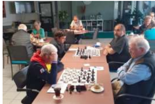
Beeld van de wedstrijd in Herkenbosch.

De Postertoren uit Herkenbosch en Wegberger Schachverein 1962 e.V. uit de Duitse plaats Wegberg hebben op zondag 4 juni hun jaarlijkse Freundschaftstreffen gespeeld. Ditmaal speelde men in Kasteelhof in Herkenbosch, het clublokaal van De Postertoren. De Duitsers wonnen met 3-4. Net als eerdere jaren werd er gespeeld op een zondagochtend in het voorjaar en ook nu werd het treffen voorafgegaan door het versterken van de inwendige mens, want op een lege maag kun je natuurlijk niet schaken.