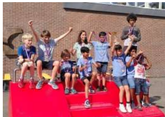
De Maastrichtse teams na afloop van de wedstrijden.