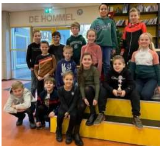
* De deelnemers aan het toernooi in Venray.