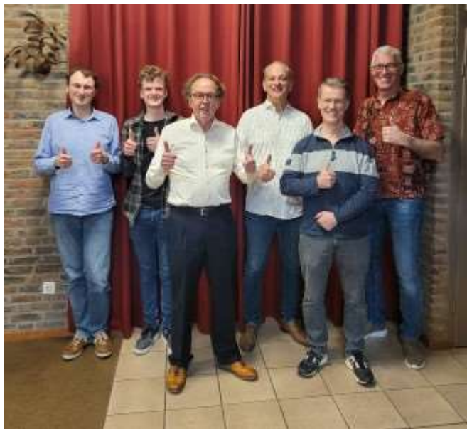
GESS 2 uit Sittard werd kampioen in de 2 e klasse.

In 3B is 't Stokpaardje uit Maasbracht kampioen geworden. In matchpunten eindigde dit team gelijk met DJC 2. Echter 't Stokpaardje had één bordpunt meer.