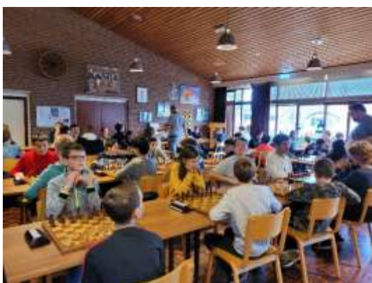
* Een goed gevulde speelzaal in Tegelen.