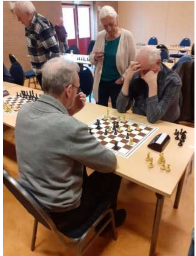
Beeld van het toernooi.