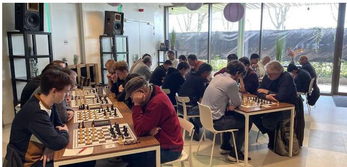
Beide speelzalen tot de laatste plaats bezet.