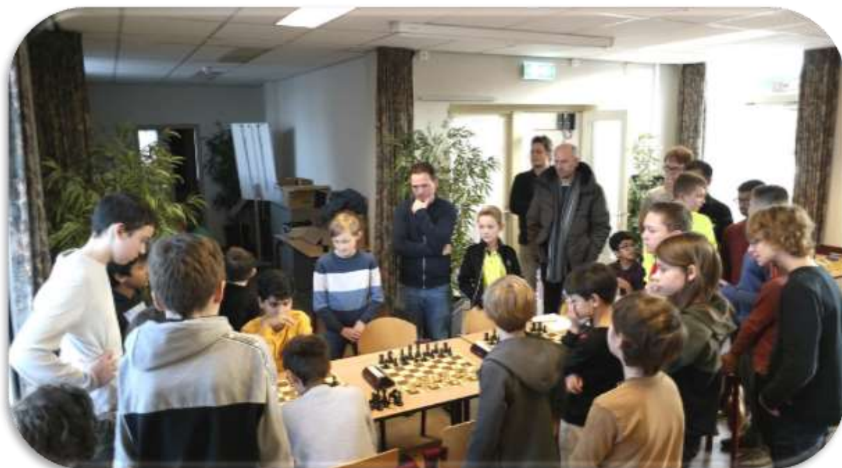
Drukte rond een van de opborden.