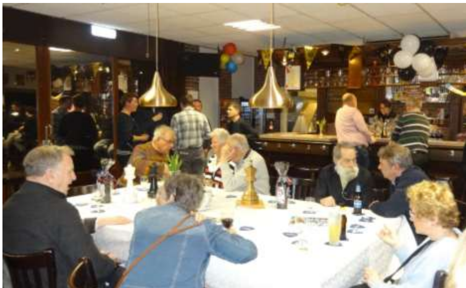
De Tegelse Schaak Vereniging vierde het jubileum met een gezellige feestavond.