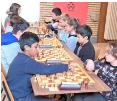
Beeld van het jeugdtoernooi in Venlo.

Op zondag 5 maart werd in Venlo het 30 e Van Spijk jeugdtoernooi gehouden, meetellend voor de Limburgse Jeugd Grand Prix. Voor de organisatie tekende de Venlose Schaak Vereniging. Men kon tevreden zijn over de deelname (76 spelers) en over het verloop. Hieronder de eindstanden aan kop.