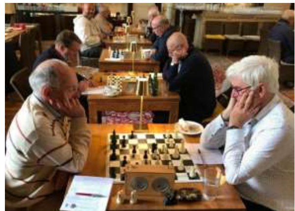
Beeld van de overdagwedstrijd.

Beide clubs hebben elke week een clubmiddag.