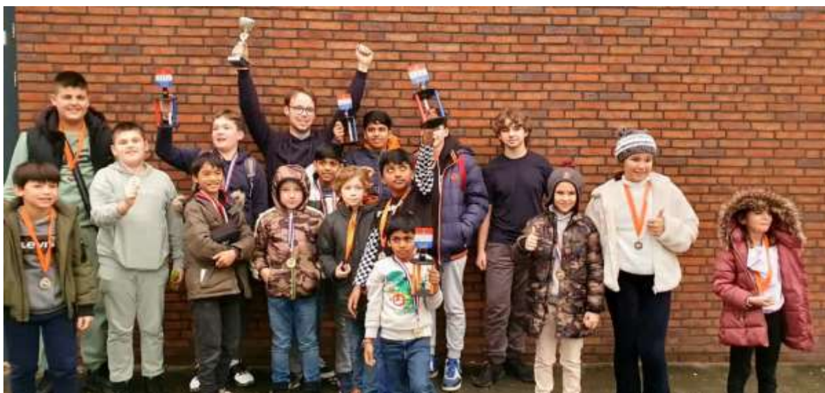
* De spelers van 'Op zijn plaats' uit Maastricht behaalden in Stein heel wat prijzen.