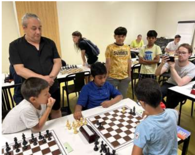
De partij van Sai en Akul trekt bekijks.

vergeten wedstrijdleraar IA Luc Cornet verliep het toernooi gesmeerd. Keurig op tijd werd de prijzuitreiking gedaan. De eindstanden aan kop in de diverse groepen: