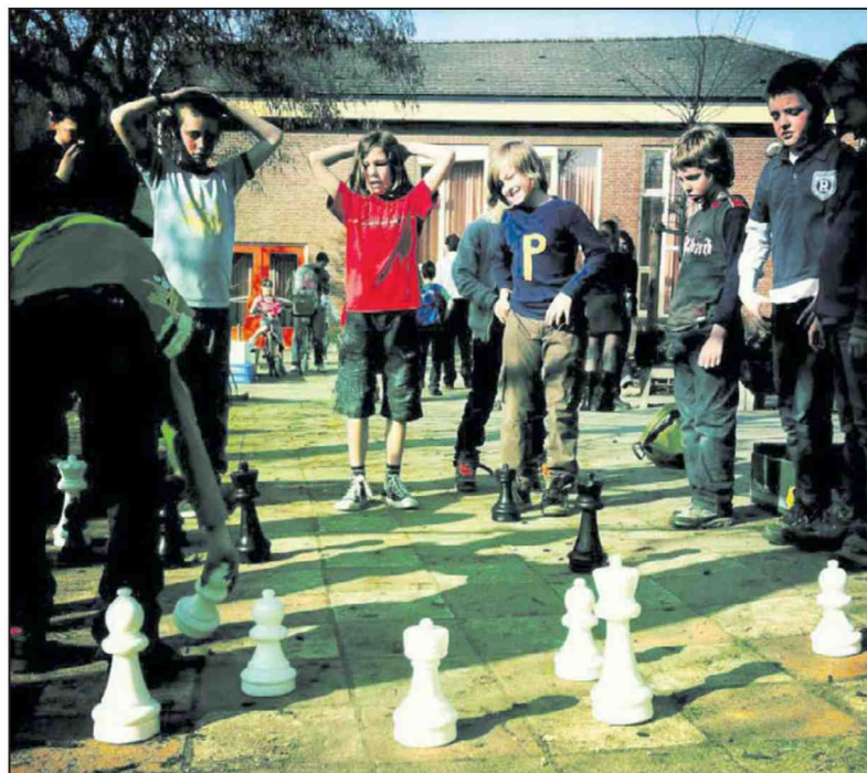
De Bernard Lievegoed School in Maastricht: schaken op het schoolplein.