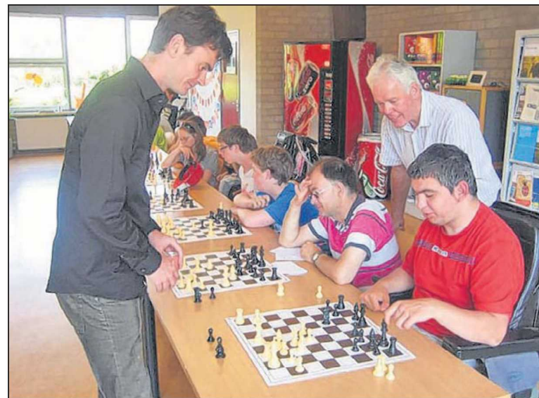
Loek van Wely gaf een simultaan tegen dertig spelers in Valkenburg.

33.Tef4 Opeens neemt wit de aanval over! De enige verdediging was 33...Dd8 wat de d-pion dekt. Nu wordt die zelfs met schaak geslagen! 33...Pd5?? 34.Tf8+ Kh7 35.Dxd3+ g6 36.hxg6+ Txf6 37.Th8+ en zwart geeft op; hij loopt sowieso binnen een aantal zetten mat (1-0)