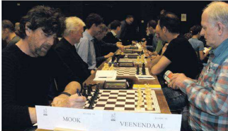
Mook – Veenendaal werd een thriller.