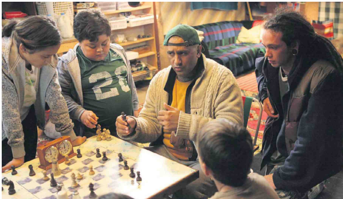
Beeld uit de film 'The Dark Horse' met acteur Cliff Curtis.