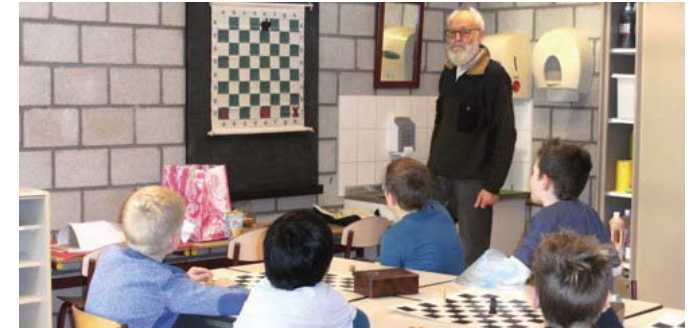
Enthousiast schaker en schaakdocent.

Mijn motivatie... „Ik ben zelf enthousiast schaker en vind schaken het mooiste spel dat er bestaat. Een mens moet zijn bijdrage leveren aan de ontwikkeling van de gemeenschap om hem heen. Door schaaklessen te geven in de naschoolse opvang kan ik iets betekenen voor de ontwikkeling van kinderen.”