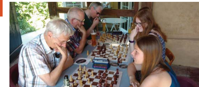
Schaken met bier en snacks.

De uitstekende sfeer binnen de vereniging komt tot uitdrukking in allerlei nevenactiviteiten, die door de