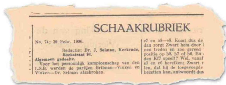
Knipsel schaakrubriek Jan Selman.

3.dxe5 Pg4 4.Pf3 Pc6 5.Lf4 Lb4+ 6.Pbd2 Hier speelt men gewoonlijk Pc3, om na De7 pion e5 met Dd5 te verdedigen 6...f6 Eenvoudiger De7. Na den tekst-zet ontstaat een wild gambietspel 7.exf6 Dxf6 8.Lxc7 Volgens Bogoljubov is e3 sterker 8...Dxb2 Na 8...d6 speelt wit h3 en bevrijdt daarna met a3 en b4 den looper 9.Lf4 Anders wordt Lc7 inderdaad ingesloten; na 9.Lg3 volgt eveneens Pd4! 10.Pxd4? Lxd2+ enz) 9...Pd4 10.Tc1 Ruil op d4 ging niet goed wegens Dxd4! 11.Lg3 of e3, Lxd2+ enz 10...0-0