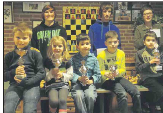
De Limburgse kampioenen in de diverse leeftijdscategorieën.