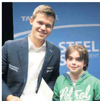
Siem van Dael met Magnus Carlsen.

ziet nu wel het verschil met de partij zonder een pion op c6. Zeer subtiel maar wel heel mooi! 20.La5 Dd4? 21.Ph5 Te6 22.Lc3 Dd8 Dit is het natuurlijk niet. Maar ook als je de pion op d3 pakt, ga je de moeilijkheden tegemoet. Op zich een heel mooi dubbelpionoffer! 23.Tad1 cxd3 24.Te3 Lc8 25.Texd3