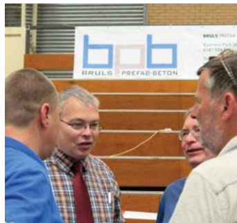
Overleg achter de schermen.