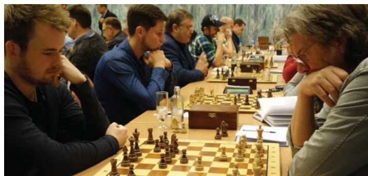
Concentratie bij het slot van de competitie.