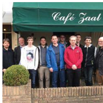
Team Voerendaal.