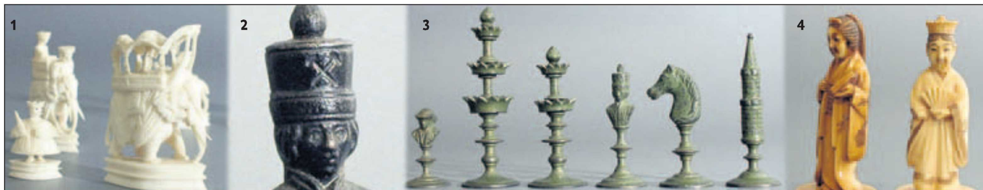
Foto 4: De beide koninginnen uit een in Japan gesneden ivooren schaakspel. Het spel dateert uit de 19e eeuw en werd gemaakt voor de export naar Europa. Links is de Japanse keizerin te zien; rechts de Chinese keizerin. Het spel heeft als thema een van de vele conflicten tussen China en Japan. In Japan gemaakte schaakspellen zijn zeer zeldzaam. De hoogte van deze figuren bedraagt 6,6 cm.

Dit teken is ook terug te vinden in mijnbouwgebieden.