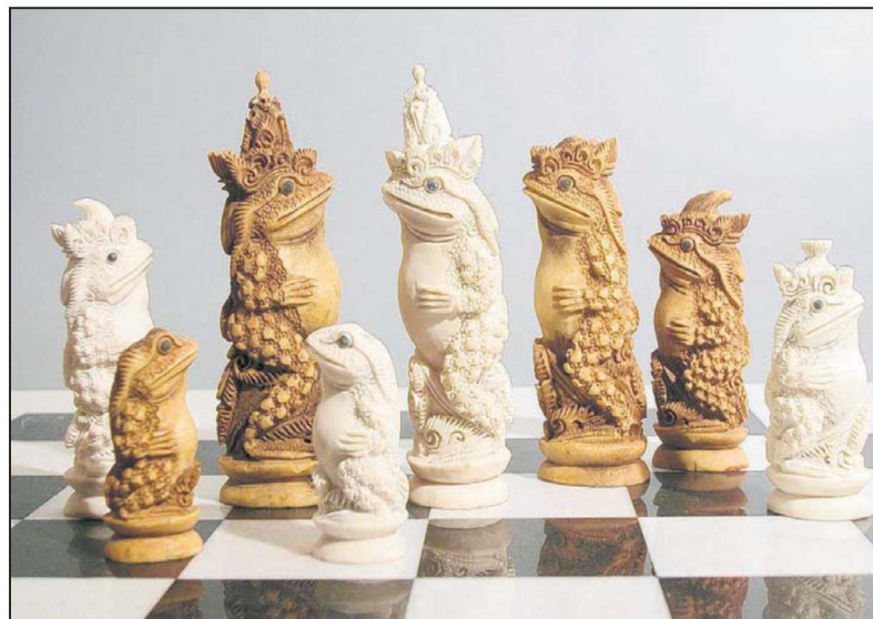
Dit schaakspel bestaande uit kikkers is gemaakt op Bali.

de partijen zijn identiek van vorm. De ene partij is helder wit. Het been van deze schaakfiguren is waarschijnlijk gebleekt met waterstofperoxide. De tegenpartij is gekleurd met theïne. De schaakstukken hebben door die stof de kleur van thee gekregen. De hoogte van de kikkerkoning bedraagt 11 centimeter. Het kleinste stuk, de pion, is 5 centimeter hoog. Bij het spel hoort een achthoekige opbergdoos met losse pootjes. Op de buitenkant van de opbergdoos is een schaakbord aangebracht. Op de vlakken naast het schaakbord zijn voorstellingen van bloemen en bladeren uitgestoken. Bijzonder bij het bord is dat de witte randvelden verbinding hebben met de witte rand en niet zijn ingelegd. Dit getuigt van groot vakmanschap. De achthoekige opbergdoos van het kikkerspel meet 50,5 bij 50,5 centimeter, het schaakbord 29 bij 29 centimeter. Een schaakspel waarbij de schaakfiguren worden uitgebeeld als kikkers is uiterst zeldzaam. In de