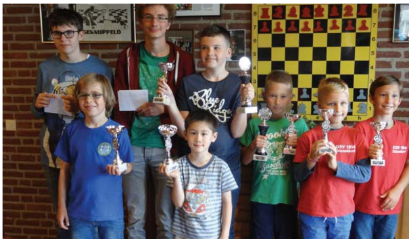
De prijswinnaars van het toernooi in Tegelen.

nu nemen steeds meer jongeren van clubs vlak over de grens deel. In Tegelen gaven jeugdspelers uit Kempen, Düsseldorf, Mönchengladbach, Nettetal en Wachtberg acte de présence. Die lieten meteen goed van zich horen. In de helft van de leeftijdscategorieën gingen ze met de eerste prijs aan de haal. De prijzenpot was traditioneel goed gevuld, zodat de schakertjes na dit gezellige toernooi niet met lege handen huiswaarts keerden.