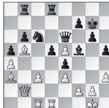
Diagram uit partij Rudi van Gool.

Daar zal 't Pionneke een gooi doen naar het kampioenschap. Voerendaal 3 staat op papier laag genoteerd en zal meer bescheiden ambities hebben. 't Pionneke heeft op weg naar de top met name Eindhoven te duchten. Het team uit Eindhoven, in een ver verleden nog landskampioen, speelt met andere spelers inmiddels al jaren op lager niveau, maar blijft een tegenstan-