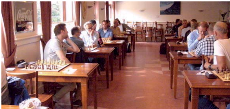
Concentratie voor aanvang van de wedstrijd.

In klasse 3H staan 't Pionneke Roermond en Voerendaal 3 op de lijst.