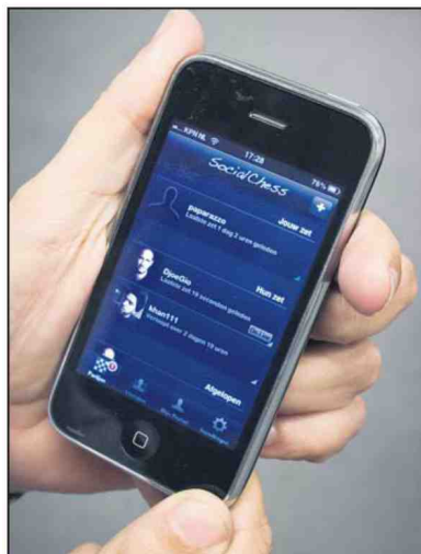
De app SocialChess op de iPhone.