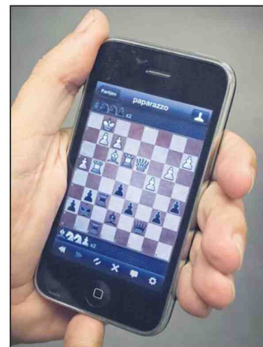
Altijd bord en stukken bij de hand.