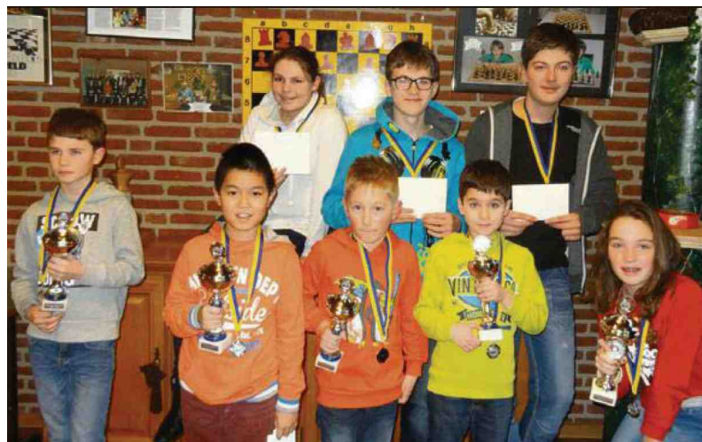
De Limburgse kampioenen (op de foto ontbreken twee spelers).