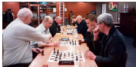
De doorgeefschakers in actie in Stein.