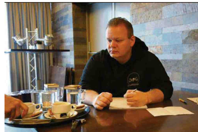
De wedstrijdleader wordt in de watten gelegd.