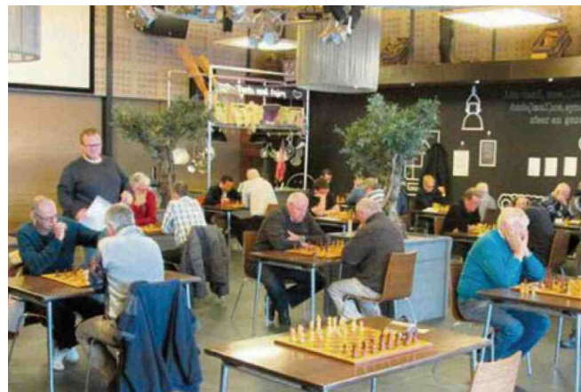
De arbiter (staand) 'in actie' in Venlo.