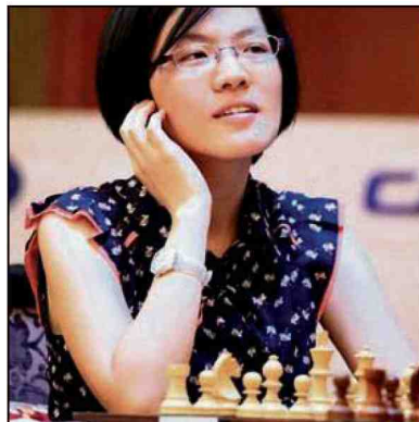
Hou Yifan.

kampioene. Het is jammer dat deze tweekamp gedeeltelijk overlapt met de aanvang van het kandidatentoernooi voor de heren in Moskou. De aandacht voor het dameskampioenschap dreigt hierdoor weg te ebben. Er wordt in de schaakwereld immers al heel lang uitgekeken naar de ontmoeting tussen acht van de beste schakers ter wereld, die in