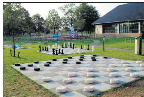
Landgoed Hommelheide, Susteren.