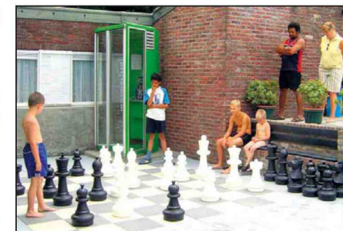
Camping 't Hemelke, Hulsberg.