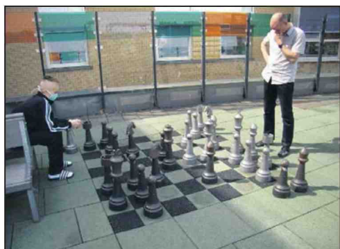
Dakterras Laurentius ziekenhuis, Roermond.