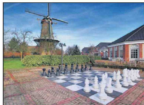
Nabij de molen in Bergambacht.