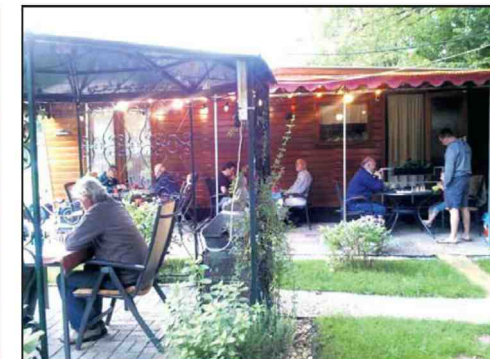
Bij de caravan van Theo de Jongh in Weert.