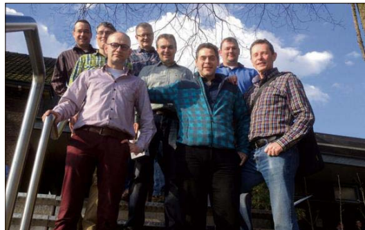
Het kampioensteam van Voerendaal 3.