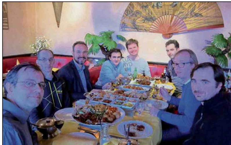
Venlo 1 viert de titel met een etentje.

een hoog bordgemiddelde 6,5 punten uit negen partijen te scoren. Hij kan dus komend jaar met eFXO Apeldoorn de Meesterklasse betreden