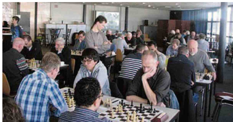
Het toernooi in Den Haag in volle gang.