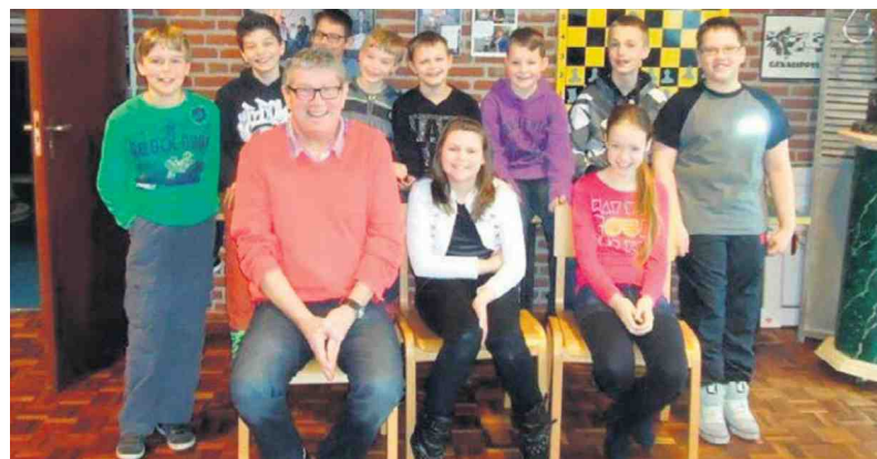
De kanjers van de Glazenap.

„Ja, alhoewel we altijd nieuwe ondersteuning kunnen gebruiken. We zetten ook oudere jeugdspelers in om de jongere te begeleiden.”