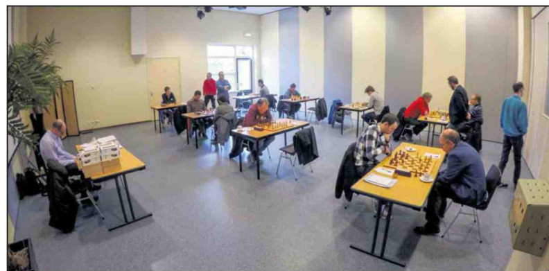
Venlo en DJC Stein werken in alle rust hun partijen af.

Mede hierdoor won Venlo met 5-3 en bezet dit team na vier speelronden met 6 punten de tweede plaats in KNSB-groep 2D. Stein staat met een puntje minder vijfde en is dus ook nog in de race voor het kampioenschap.