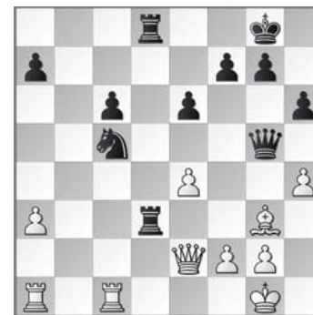
Diagram Hanssen - Van Os.