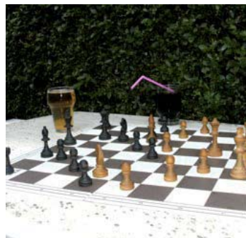
Schaken in de buitenlucht.