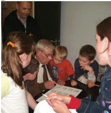
2003. examens nakiiken.

Het viel echter allemaal reuze mee met uw strengheid. De examinatoren haalden hun pionnen-, toren- of koningsdiploma en achter die strenge blik bleek een heel aimabel man schuil te gaan, die met een brede glimlach de diploma's uitreikte. Later leerde ik dat u een belangrijk man was in de Limburgse schaakwereld. Behalve examinerator was u diplomaconsul en gaf u schaakles op diverse scholen in Maastricht. Tevens was u ongeveer 25 jaar lid van het bestuur van de Limburgse Schaakbond. Uw verdiensten bleven niet onopgemerkt.