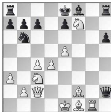
Uit de zesde ronde KNSB-strijd.

„Aan de uitwedstrijden met Venlo 1 heb ik bijzondere herinneringen. In Rotterdam moesten we een keer met de tram. Een vervoermiddel waar Limburgers niet zo aan gewend zijn. Dat bleek, toen bij het uitstappen een teamlid eerst eens zijn hoofd naar buiten stak om te zien of hij er veilig uit kon. Hij wachtte echter zo lang, dat de tramdeur alweer sloot en de onfortuinlijke schaker met zijn hoofd klem kwam te zitten. Commentaar van de machinist: “Tja, dat moet je natuurlijk ook niet doen hè...”