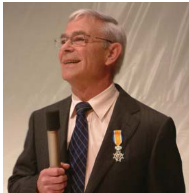
2005. koninklijk onderscheiden.