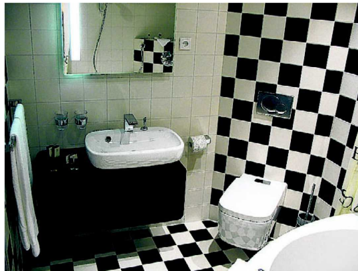
Het heerlijkste bad neem je in een speciale schaakkamer.