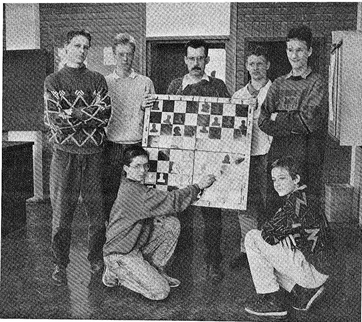
● Een aantal leerlingen van het Eijkhagencollege in Schaesberg, die momenteel slag levert met scholieren in de Sowjet-Unie.

LANDGRAAF - Een koude kermis. Daar zullen de leerlingen van een school in het Russische Kitskany in de republiek Moldavië van thuishomen als het aan de schaakfanaten van het Eijkhagencollege in Landgraaf ligt. De leerlingen van de scholen spelen sinds niet al te lange tijd een correspondentie-schaakmatch met elkaar. „Een van de partijen verloopt zoals die tussen Karpov en Lutikov in de strijd om het Russisch kampioenschap van 1979”, vertelt Toon Peters, leraar scheikunde en de 'goeroe' van de schaakclub van Eijkhagen. „Waarschijnlijk gaan onze tegenspelers er van uit dat we die partij wel niet zullen kennen, maar ze zullen hopelijk onaangenaam verrast worden door onze volgende sterke zet.”