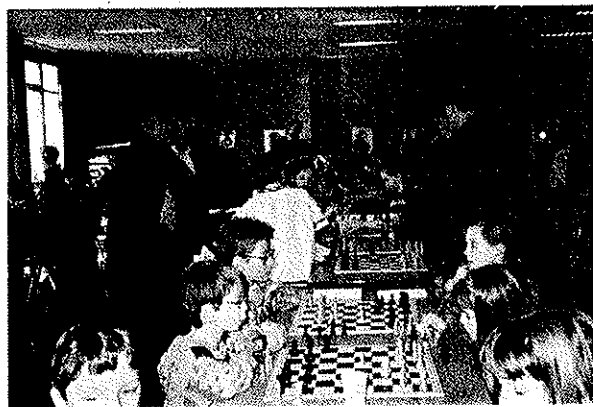
De jeugd is gefacineerd van het boeiende denkspel Schaken

Tevens werd gekozen voor het middag- en avondschaak. De schaakuren zijn nu: dinsdagmiddag van 14.00 tot 17.00 uur en op donderdagavond vanaf 20.00 uur in café 't Trefpunt aan de Stationsstraat 108 te Elsloo.