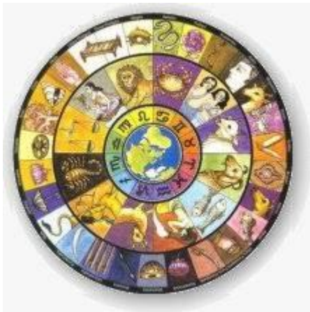
De gevederde slang

In oude, apocriefe Sanskrietische geschriften uit die periode wordt gewag gemaakt van een verbod voor astrologen om Chaturanga te spelen met de gewone schakers. 2 Zij - de astrolo's - zouden immers gebruik kunnen maken van hun door wichelarij verworven inzichten van het verloop van een nog te spelen partij. Gevalletje voorkennis zouden we vandaag de dag mopperen... Ook het afsluiten van weddenschappen en deelname aan kansspelen was hen niet toegestaan. Een symbool met o.a. de twaalf tekens van de dierenriem uit de vedische astrologie: