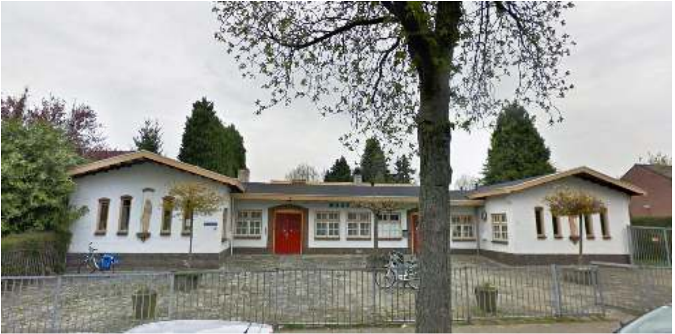
De vervangende speellocatie op 28 september 2019: Gemeenschapshuis De Maagdenberg