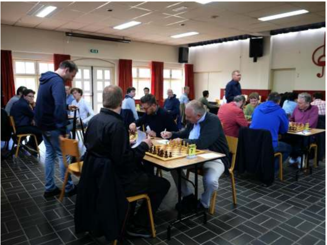
De speelzaal in Gemeenschapshuis De Maagdenberg