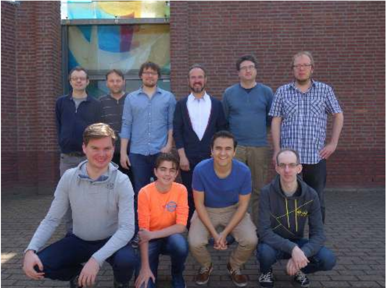
Venlo 1 eindigde op de vierde plaats in klasse 1B KNSB...