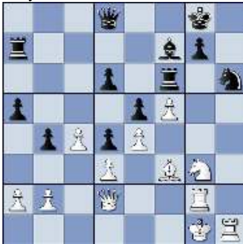
Diagram na Le8-f7? De beslissende fout. Nu wordt Bert gemengeld en geplet...