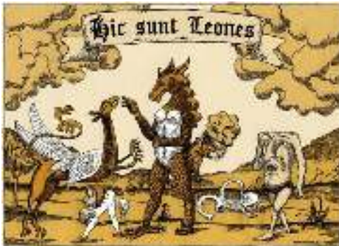
Ook wel: Hic sunt dracones

ontsnapt na 43... d5? (Dc5! wint) sukkelt deze pot na 53 zetten naar remise.