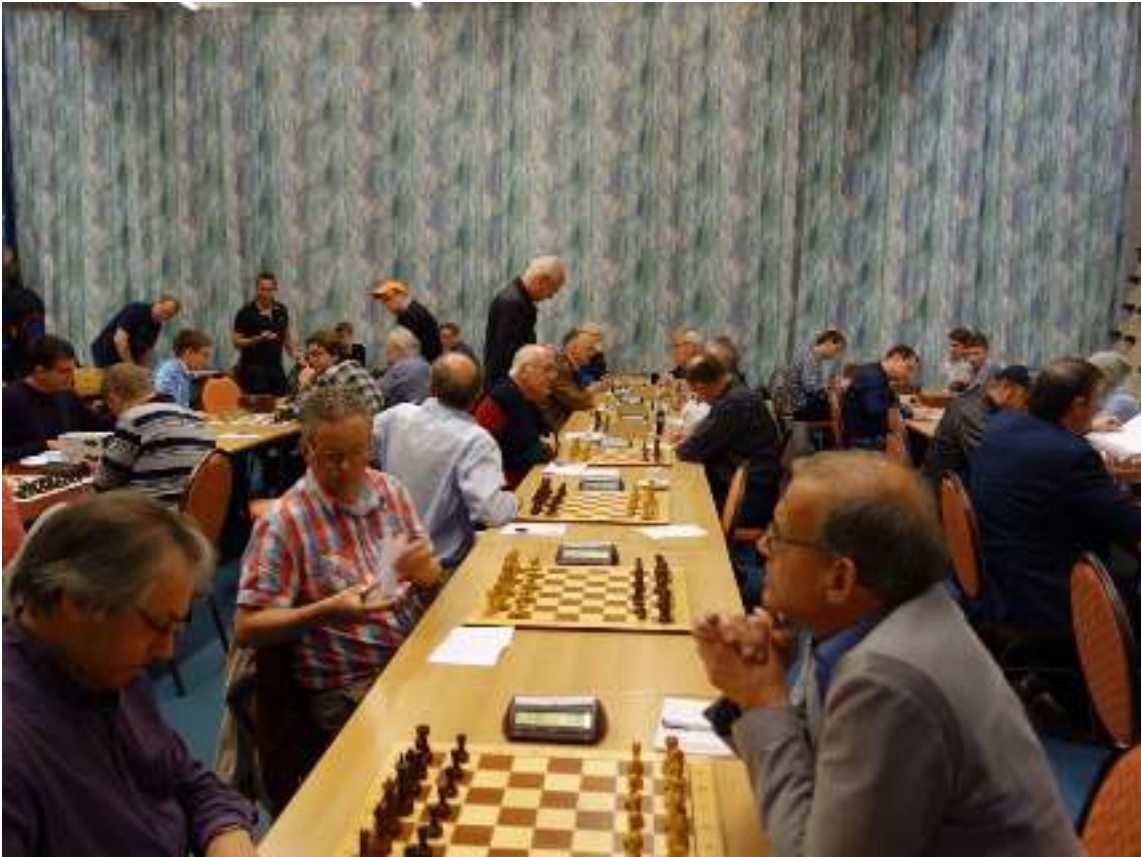
Slotronde.....er is nog van alles mogelijk