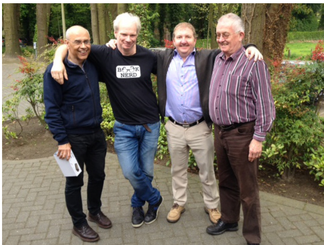
Venlo 4 kampioen klasse 3 van de LiSB competitie

OFFICIEEL ORGAAN VAN DE VENLOSE SCHAAKVERENIGING