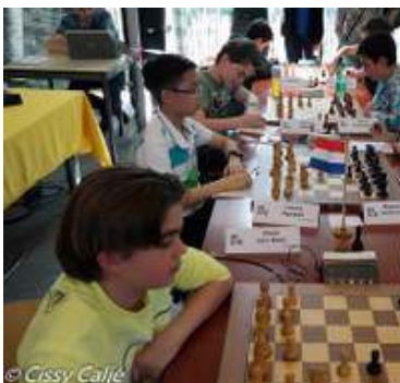
Siem in actie

SM: "En er volgde Txh7! Waarna zwart meteen opgaf. Na 39...Kxh7 wint wit met 30.Td7+ Kg8 31.Tg7+ Kxh8 32.Txg6+"