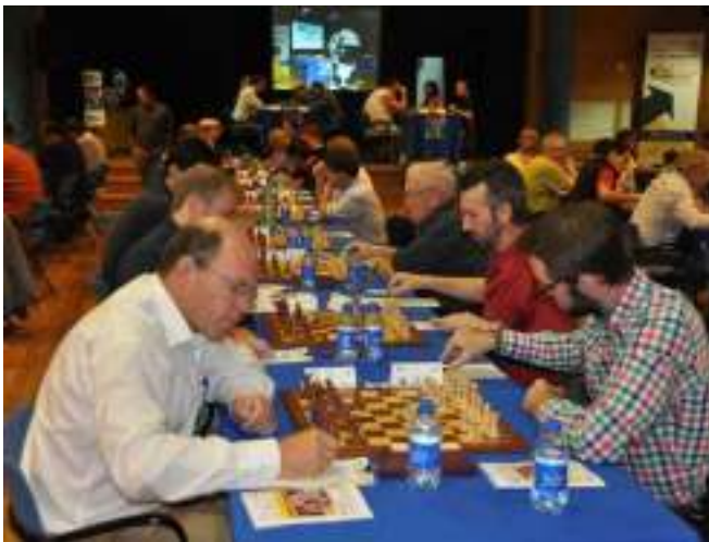
Tijdens de laatste ronde