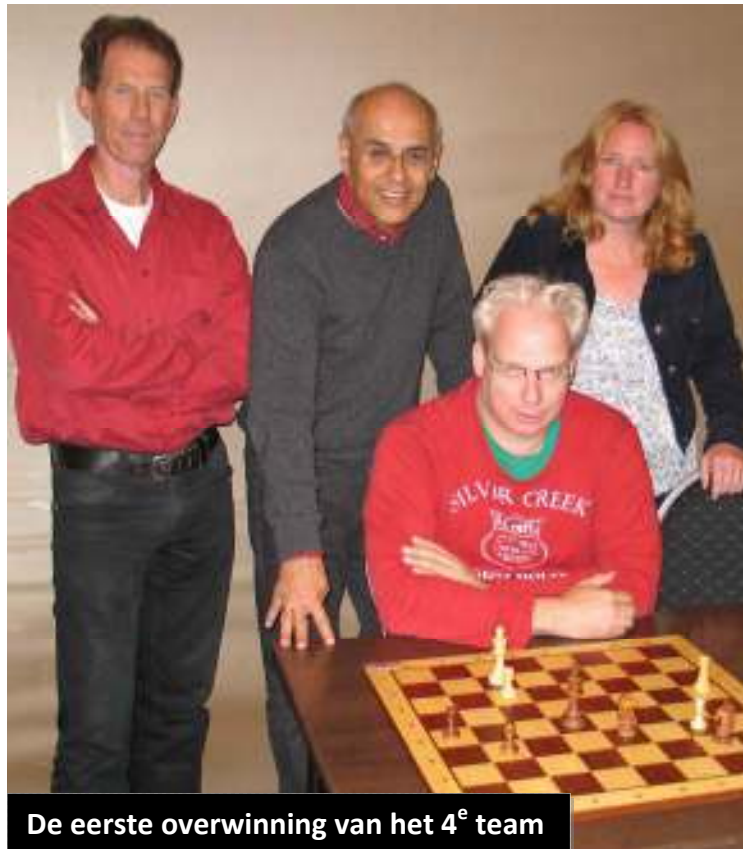
De eerste overwinning van het 4 e team

OFFICIEEL ORGAAN VAN DE KONINKLIJK ERKENDE VENLOSE SCHAAKVERENIGING