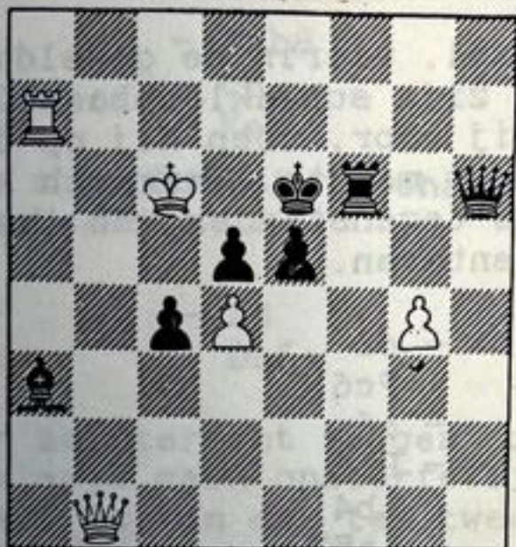
Diagram 2: wit aan zet geeft in 2 zetten mat. Hoe?

Diagram 1: wit aan zet geeft in 2 zetten mat. Zie je hoe?