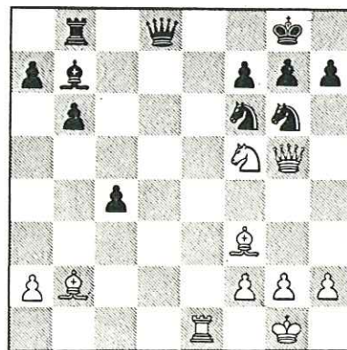
Diagram bij probleem 2.Wit geeft mat in 6 zetten.Oplossing in Schaakmatje nr. 82.