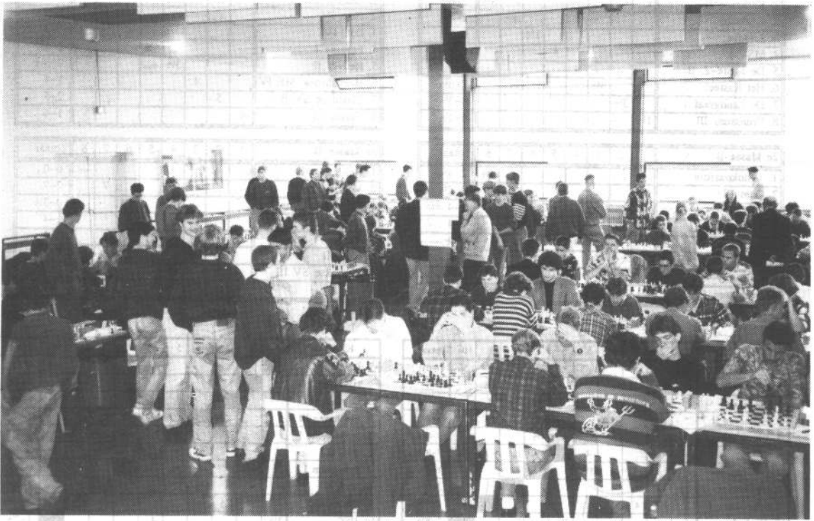
* Het Hutton-toernooi in Weert: een overzicht van de speelzaal.