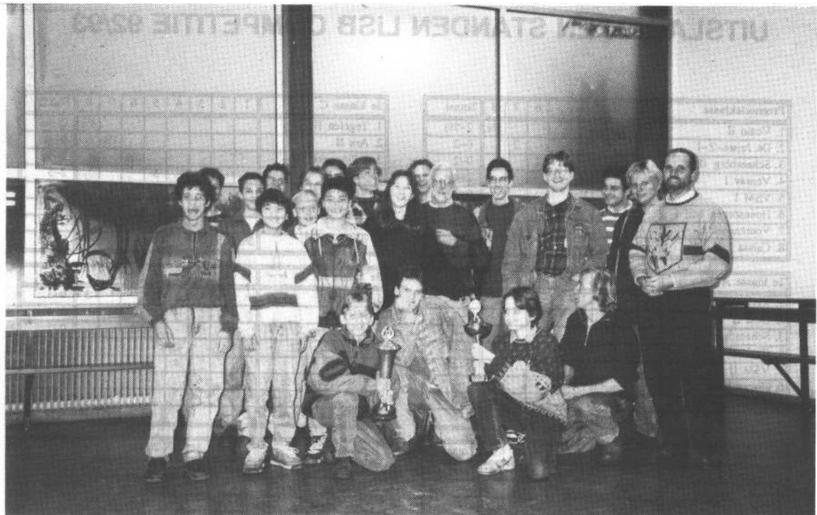
* De winnaars van het 36e Hutton-toernooi: het team uit Brabant. De Brabanders poseerden na de prijsuitreiking voor fotograaf Eric Schouten.