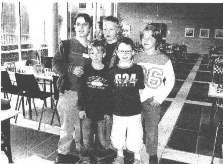
* Het team van SV Leudal in Tilburg:

In Tilburg vond op zaterdag 21 mei het Nederlands kampioenschap voor clubteams voor de E-jeugd (tot 10 jaar) plaats. Er werden 7 ronden gespeeld. Vanuit de Limburgse schaakbond namen hier twee teams aan deel: SV Leudal (Haelen) en SV MSV-VSM (Maastricht). Beide teams leverden een goede prestatie. SV Leudal wist het zelfs tot een gedeelde 10 e plaats te schoppen. Een voor Limburgse begrippen ongekende prestatie, gesteund door een ruime afvaardiging van enthousiaste supporters uit Midden-Limburg.