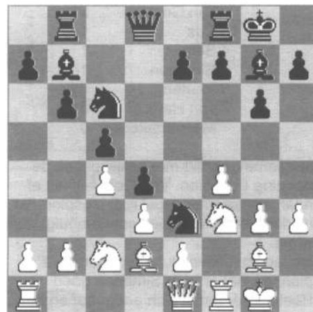
Diagram na 13...Pe3

14.Pxe3 dxe3 15.Lc3 Pd4 16.Lxd4 Lxd4 17.Pxc4 cxd4 18. b4 f5 Snel actief worden op de koningsvleugel.