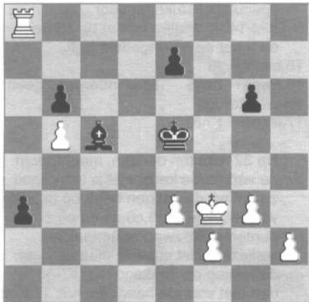
Diagram na 40.Ke5