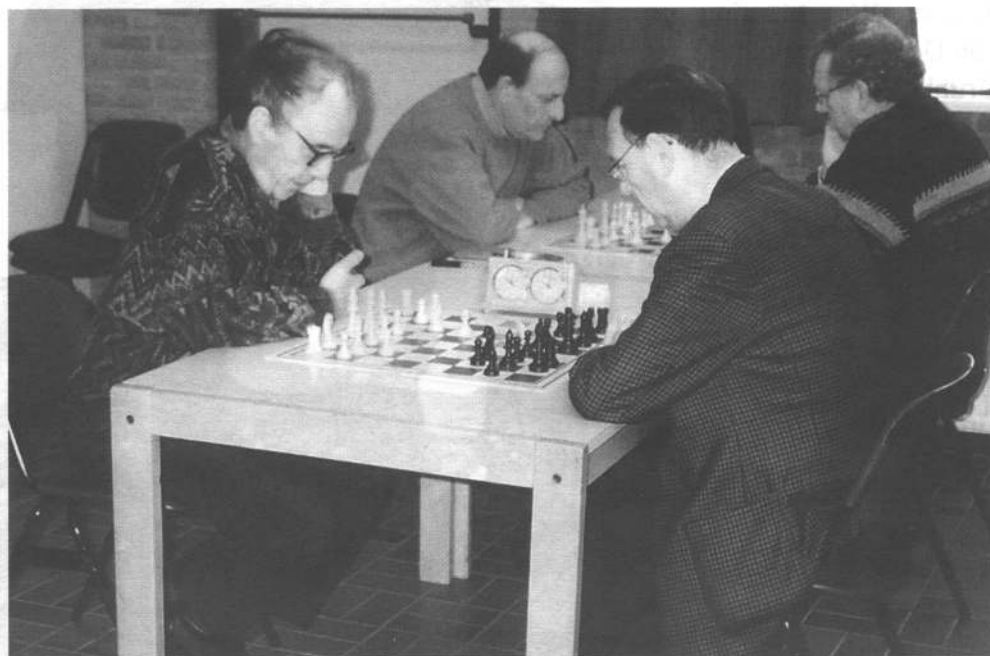
Groep 1 aan het werk tijdens het toernooi voor vijftigplussers in Hoensbroek