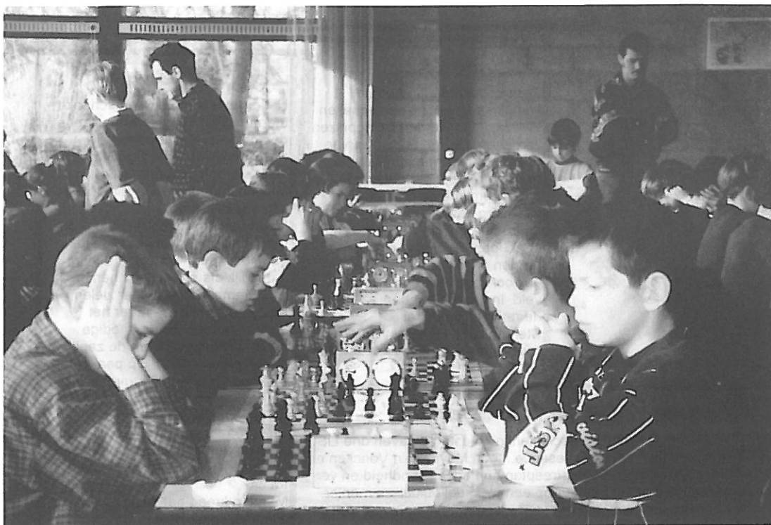
* Beelden van de Limburgse kampioenschappen voor basisscholen.