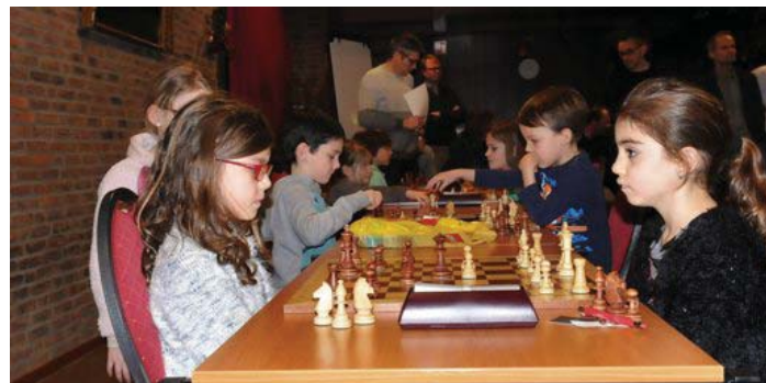
SamSam-jeugdtoernooi in Klimmen.

den afgelast wegens een gebrek aan inschrijvingen. De organisatie weet dat onder meer aan de speeldatum (rond sinterklaas) en verplaatste de wedstrijden naar begin februari. Het prijzengeld voor de hoogste leeftijdscategorieën werd verhoogd en er werd veel reclame voor het evenement gemaakt. Het was voor de negenkoppige organisatie nog een hele klus om scholen en verenigingen in de verre omtrek te benaderen. Uiteindelijk leidden alle inspanningen wel tot het gewenste resultaat. Bijna zestig kinderen uit binnen én buitenland vonden de weg naar Café Zalencentrum Keulen en beleefden daar een genoeglijke en spannende middag. Ze werden flink verwend met een hapje, een drankje en een tombola. Het toernooi zelf verliep „ge-