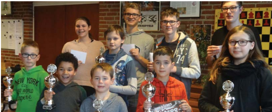
De jeugdkampioenen van Limburg.

ter alleen in de speelzaal waar te nemen. Tussen de ronden verzamelen de jeugdige schakers zich druk babbelend in de bar-annex analyse-ruimte waar, naast het schaakbord, ook de iPad de aandacht absorbeert. Dan blijkt dat de deelnemers één grote vriendengroep vormen, die geniet van een weekeinde toernooispiel in Tegelen. Het ziet er overigens naar uit dat het voor de jeugdcategorieën A en B en de meisjescategorieën A, B en C de laatste keer is, dat ze zich via het Limburgs kampioenschap voor het NK kunnen plaatsen. Op 10 december jongstleden heeft de Bondsraad van de KNSB namelijk een voorstel voor een nieuwe opzet van de kwalificaties voor het NK goedgekeurd. In een periode van zeven maanden gaat men vier kwalificatietoernooien houden, geografisch verspreid