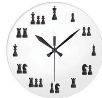
De klok tikt voort in het nieuwe schaakjaar.

Hier wordt dus een andere verbinding met de tijd gelegd: leeftijd. „Hé, is hier geen sprake van leeftijdsdiscriminatie?” hoor ik u roepen. Ach, elke sport en elke vereniging kent zijn leeftijdsgroepen met hun wensen en behoeften. De Tegelse SV geeft in Limburg de toon aan als het om de jeugd gaat. U kunt zich voorstellen dat de oudere garde ook wel eens een keer onderling een toernooi wil afwerken, zonder telkens door een snotneus te kijk te worden gezet. De deelnemers kwamen uit alle windrichtingen. Zo werden maar liefst elf groepen gevuld. Er waren tenslotte vijftien win-