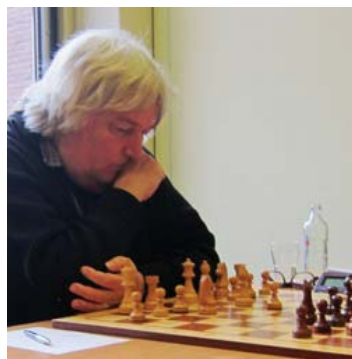
Jan Timman.

een periode dat de voormalige Sovjet-Unie de schaakwereld domineerde in de personen van wereldkampioen Anatoly Karpov en zijn rivaal Viktor Korchnoi. Na een aantal keren in de finales van de kandidatenmatches voor het wereldkampioenschap te zijn uitgeschakeld, kon hij in 1993 onverwacht toch een WK-match spelen tegen Anatoly Karpov. Dat kwam omdat de toenmalige finalisten, Garry Kasparov en Nigel Short, zich terugtrokken uit de FIDE en een WK-match voor de door Kasparov opgerichte PCA speelden. Timman verloor, maar speelde oktober jongstleden in Moermansk nog een korte tweekamp tegen Karpov. Die won hij met 2,5 - 1,5. Timman draait dus al heel wat jaren op hoog niveau mee. Hij behoort echter niet meer tot de hui-