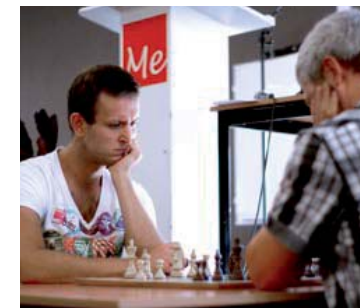
Het Open Limburgs kampioenschap snelschaak.