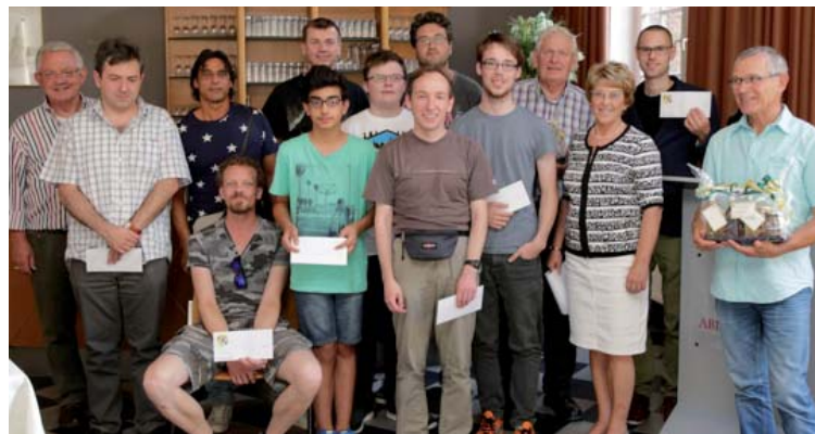
Een sterk deelnemersveld op het Eurode Open.