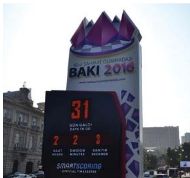
Nog 31 dagen en dan begint de schaakolympiade in Bakoe.

hiaat sloeg in de wedstrijdenreeks. De organisatie ziet er tegenwoordig heel anders uit dan toen. Met plusminus 170 landen is het nu het vierde grootste sportevenement in de wereld. Ook het huidige Nederlandse team ziet er heel anders uit. Behalve de heren zijn nu ook de dames van de partij, die overigens wel hun eigen toernooi spelen. De herenploeg bestaat uit jonge spelers die, aangevoerd door 's lands wereldtopper Anish Giri, zich staande moeten zien te houden in een zwaar deelnemersveld.