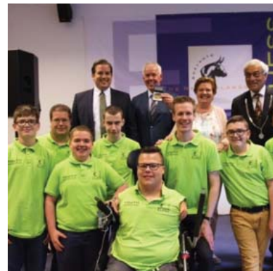
De schaakjeugd.

ler kloppen. Dat is iets anders dan de verharding en de verkilling, die nu in Europa dreigen plaats te vinden.” Lenaers: „Juist dit soort initiatieven laat zien dat je ook zonder politiek, ook zonder bureaucratie en ook zonder grote discussies op het Europese toneel heel goed kan werken aan een stukje begrip tussen landen, aan verbindingen over grenzen heen en zeker als het gaat